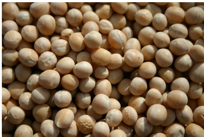
Ærter. (klik på billedet for stor udgave)